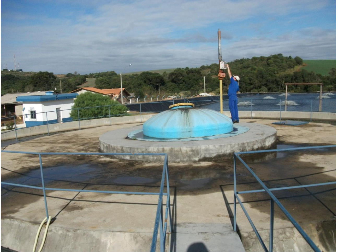
Figura 3. Parte central do reator mostrando a cúpula a ser coberta. Essa tampa de fibra está posta provisoriamente.