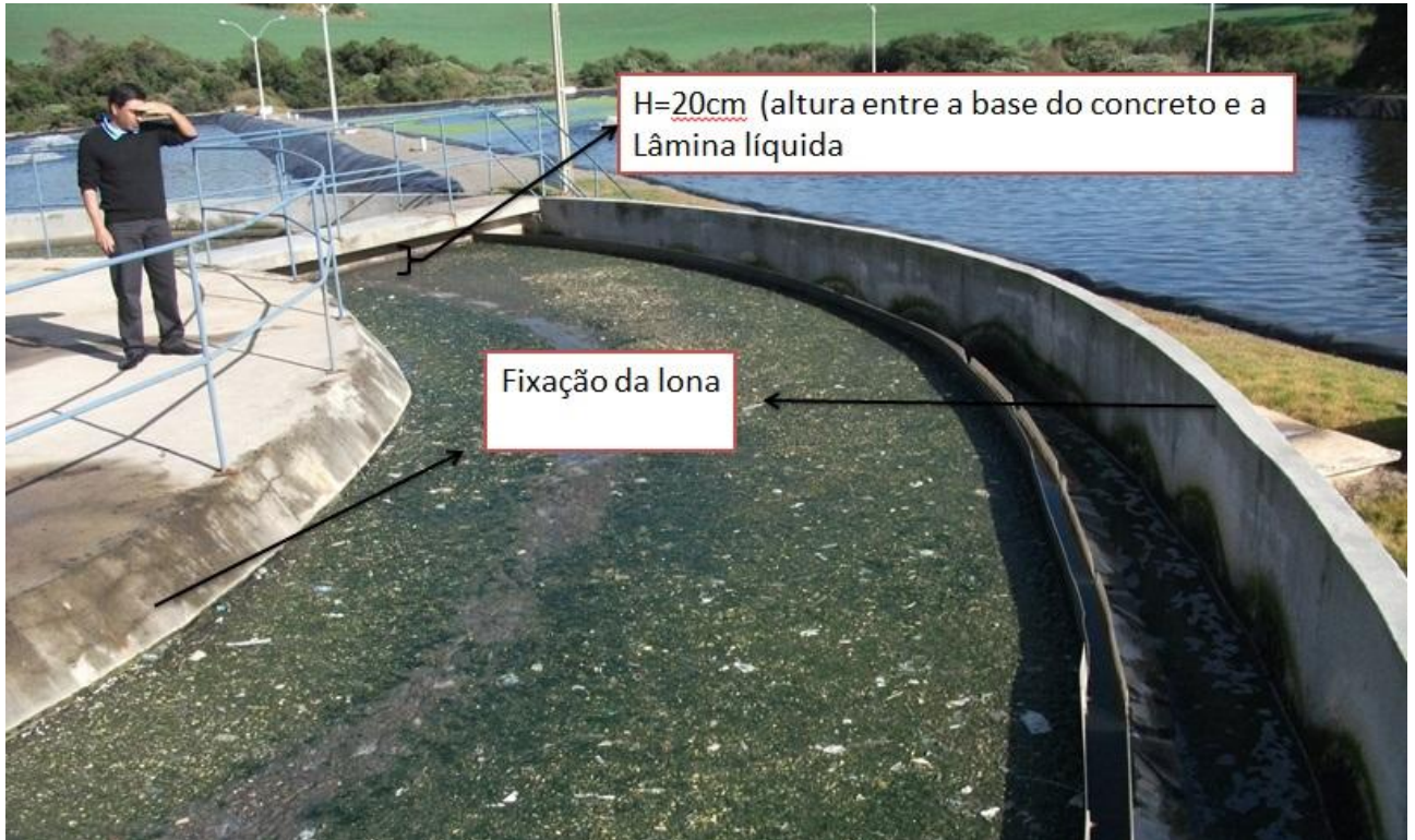
Figura 2. Esquema da fixação das lonas mostrando ¼ da área lateral a ser coberta.